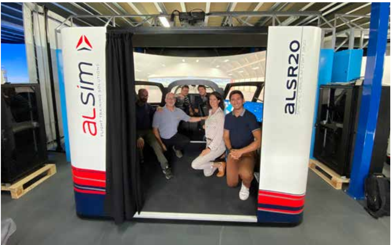
Das Team von ALSIM und der School4Pilots nach erfolgreicher Abnahme des Cirrus-Simulators im Showroom in Nantes

Direkt neben unserem Flugschulgebäude war eine seit Jahren ungenutzte Fläche, die sich förmlich anbot, bebaut zu werden. Wir informierten die Flughafengesellschaft über unsere Pläne und nach einigen Meetings waren wir uns grundsätzlich einig, wie wir diese Fläche nutzen können und dürfen. Die Planung konnte also beginnen. Es war Mai, und der Flugschulbetrieb wurde langsam wieder intensiver.