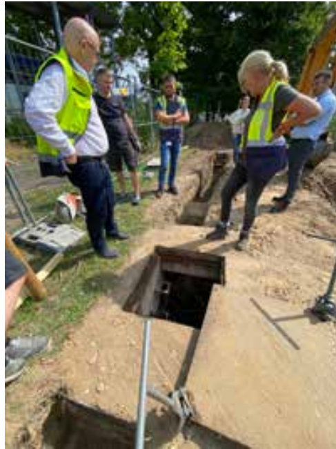
Oh Gott, ein Loch? Die Tiefbauabteilung des Airports bei der Prüfung

Flughäfen sind zulassungsrechtlich Ländersache und eher wie ein „Privatgelände“ zu betrachten. Die jeweilige Betreibergesellschaft kann und muss in vielen Punkten viele Stellen mit in eine Entscheidung einbeziehen. Zumindest ist man an allerlei Vorschrif-