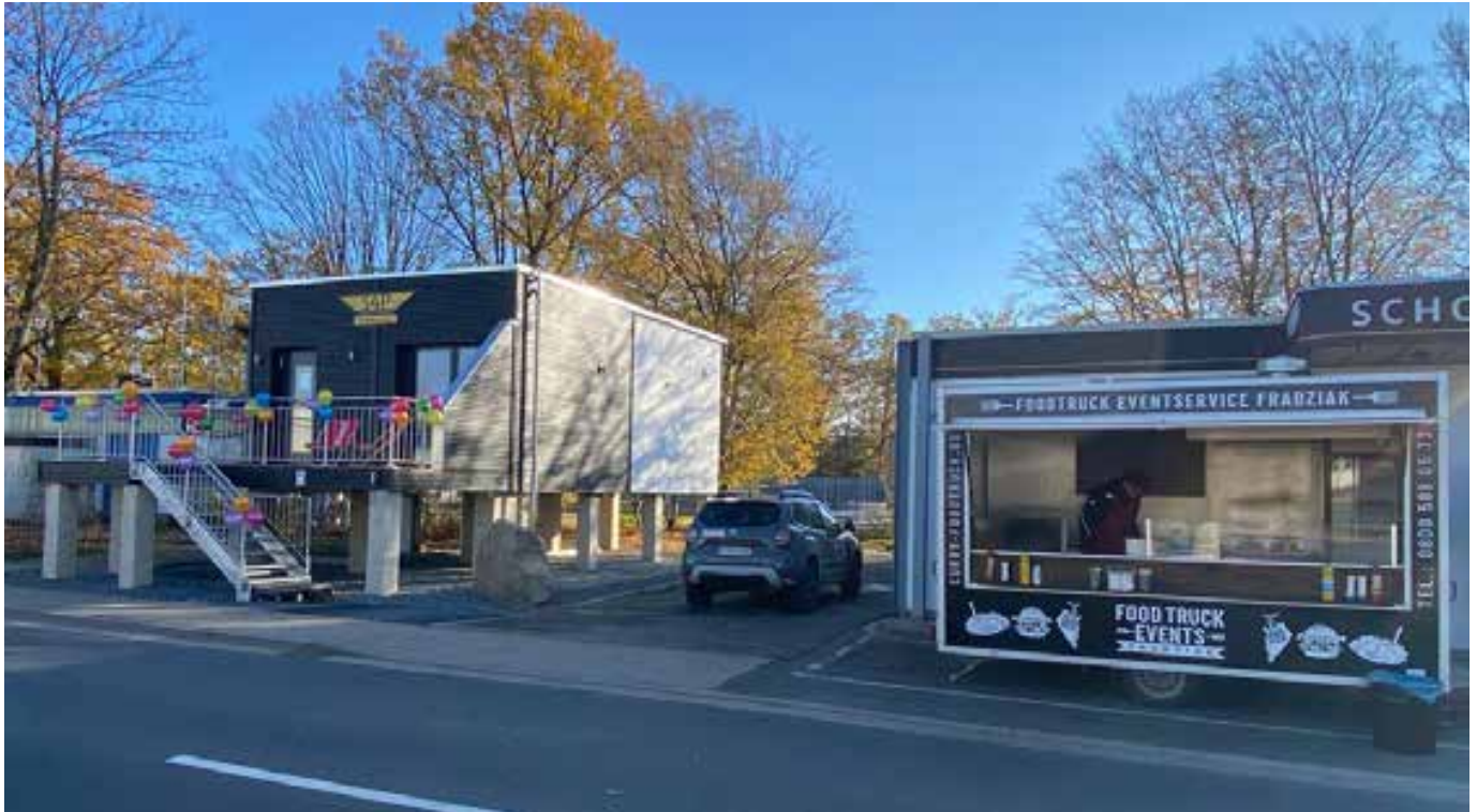
Das neue S4P SimulatorCenter kurz vor der Eröffnungsfeier am 19. November 2022